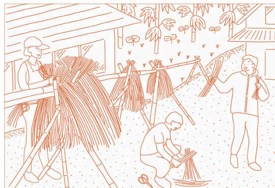
稲わらをつかった垣根づくり

稲刈り後の稲を天日干しするための「はざかけ」の技術をつかって、古民家の西側に稲わらの垣根をつくりまします。